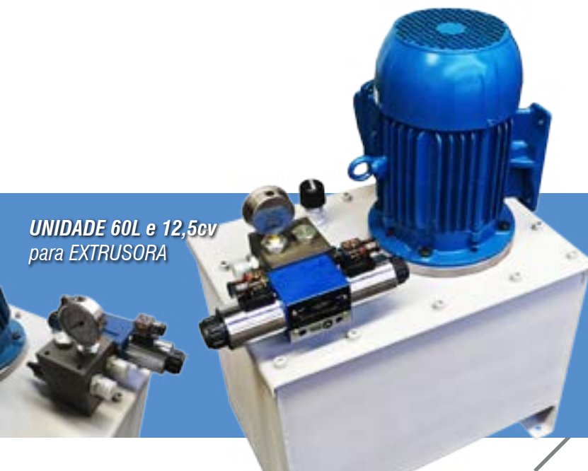
UNIDADE 60L e 12,5cv para EXTRUSORA