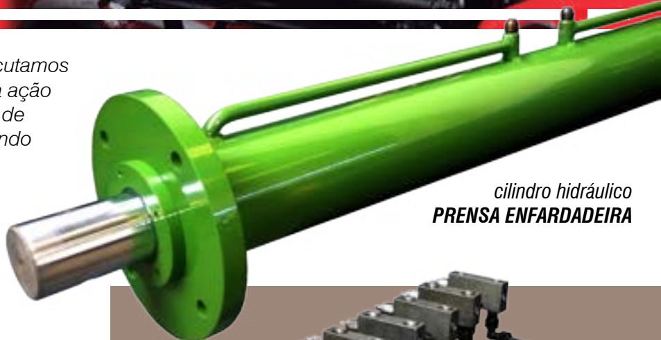
cilindro hidráulico PRENSA ENFARDADEIRA