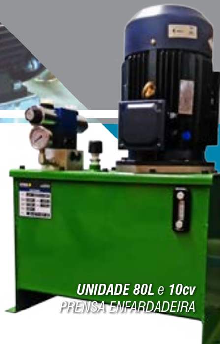
UNIDADE 80L e 10cv PRENSA ENFARDADEIRA

Trabalhamos com reservatórios padronizados ou sob medida de 10 a 400 litros podendo ser fornecida com acionamento manual ou elétrico e agregar acessórios, como manômetros, pressostatos e demais itens para supervisão.