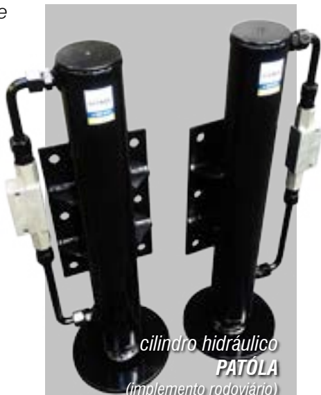
cilindro hidráulico PATÓLA (implemento rodoviário)

Todos os equipamentos que são fabricados pela HYMA , passam por processos de controle de qualidade em medições e por rigorosos testes de funcionamento.