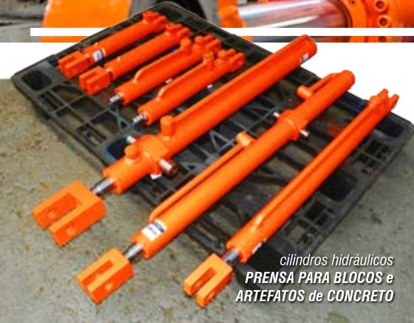
cilindros hidráulicos PRENSA PARA BLOCOS e ARTEFATOS de CONCRETO