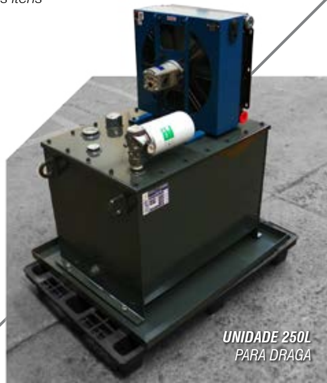
UNIDADE 250L PARA DRAGA