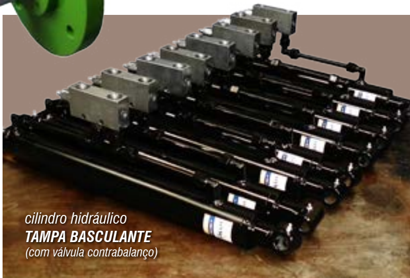
cilindro hidráulico TAMPA BASCULANTE (com válvula contrabalanço)

Contamos com uma equipe altamente qualificada e pronta para lhe atender. Os equipamentos são desenvolvidos pelo departamento de engenharia e fabricados de acordo com as especificações e necessidades de nossos clientes.