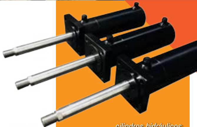
cilindros hidráulicos TROCA DE TELA (extrusora de plástico)