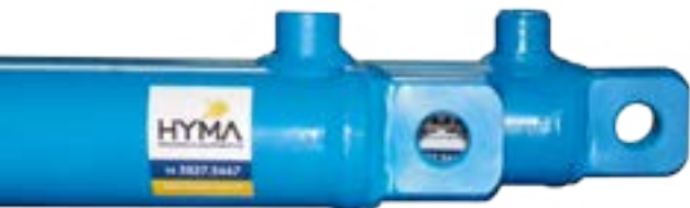
cilindro hidráulico TELESCÓPICO (dupla ação)

Adequamos também em nossos projetos itens adicionais como sistemas de amortecimento, hastes duplas, olhais, rótulas, entre outros.