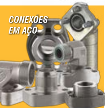
CONEXÕES EM AÇO