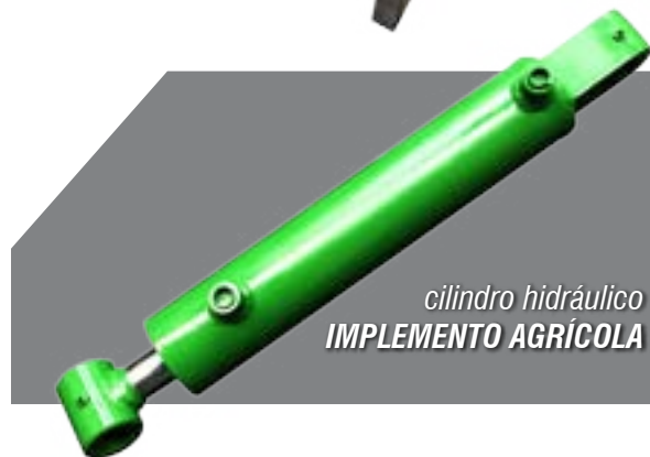
cilindro hidráulico IMPLEMENTO AGRÍCOLA

Consulte nosso Depto. Comercial e solicite um orçamento para o seu equipamento.