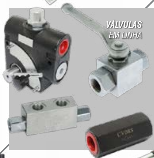
VÁLVULAS EM LINHA